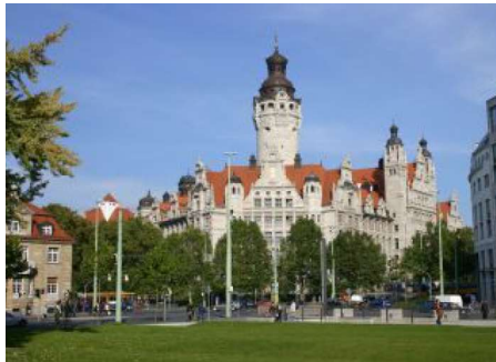
Randy Kühn / Universität Leipzig, SUK

Sektion „Endokrinologie-AssistentInnen DGE“